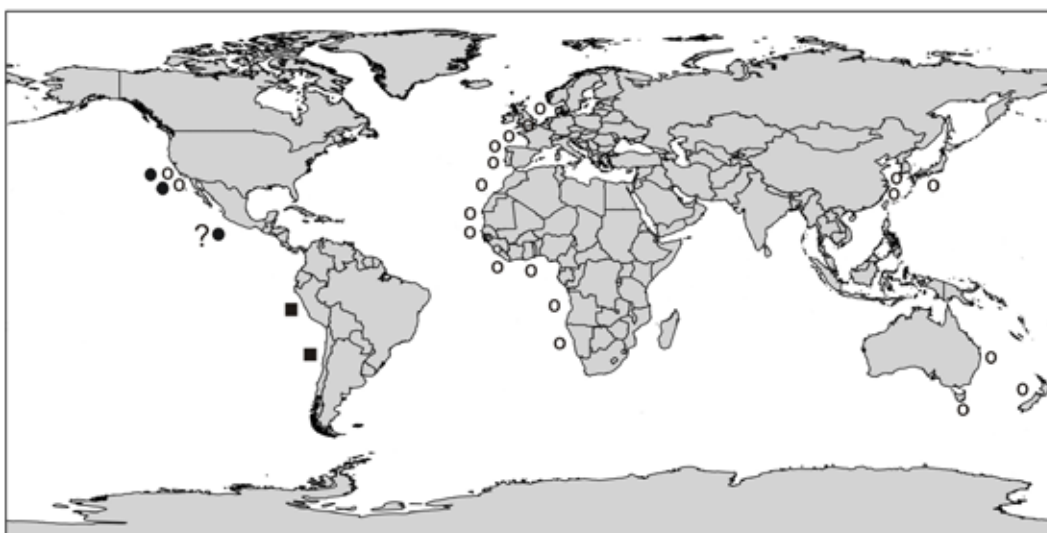
Fig. 2. Distribución mundial de Grateloupia turuturu ○, G. californica ● y G. doryphora ■. (? poblaciones de Grateloupia por corroborar su determinación)

ción encontrada en el Puerto de Ensenada, para dar seguimiento de su posible dispersión e impacto sobre las especies locales, ya que su naturaleza de especie invasora la convierte en un riesgo ecológico (Marston et al. , 2002).