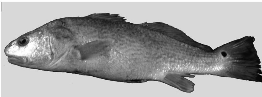
Figura 2. Vista lateral de la corvineta ocelada Sciaenops ocellatus (ECOOSC 5595 34 mm LT).