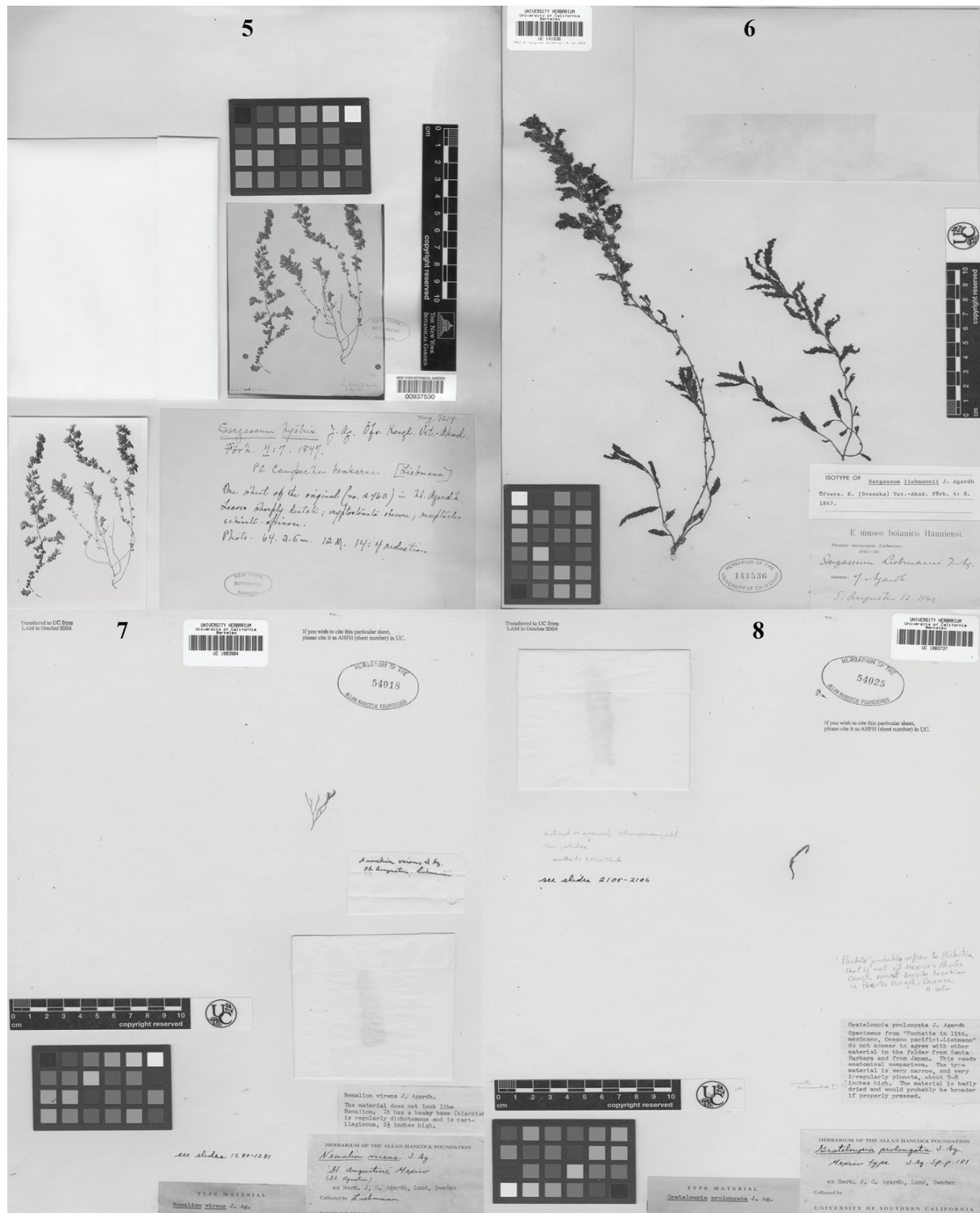
Figuras 5-8. 5. Sargassum hystrix (holotipo en NY 937530) New Yor Botanical Garden; 6. Sargassum liebmannii (isotipo en UC 141536), University Herbarium, University of California at Berkeley; 7. Nemalion virens (isotipo en UC1883904) University Herbarium, University of California at Berkeley; 8. Grateloupia prolongata (Isotipo AHFH 54025 en UC 1883737) University Herbarium, University of California at Berkeley. Acrónimos de los herbarios de acuerdo a Thiers (2022).