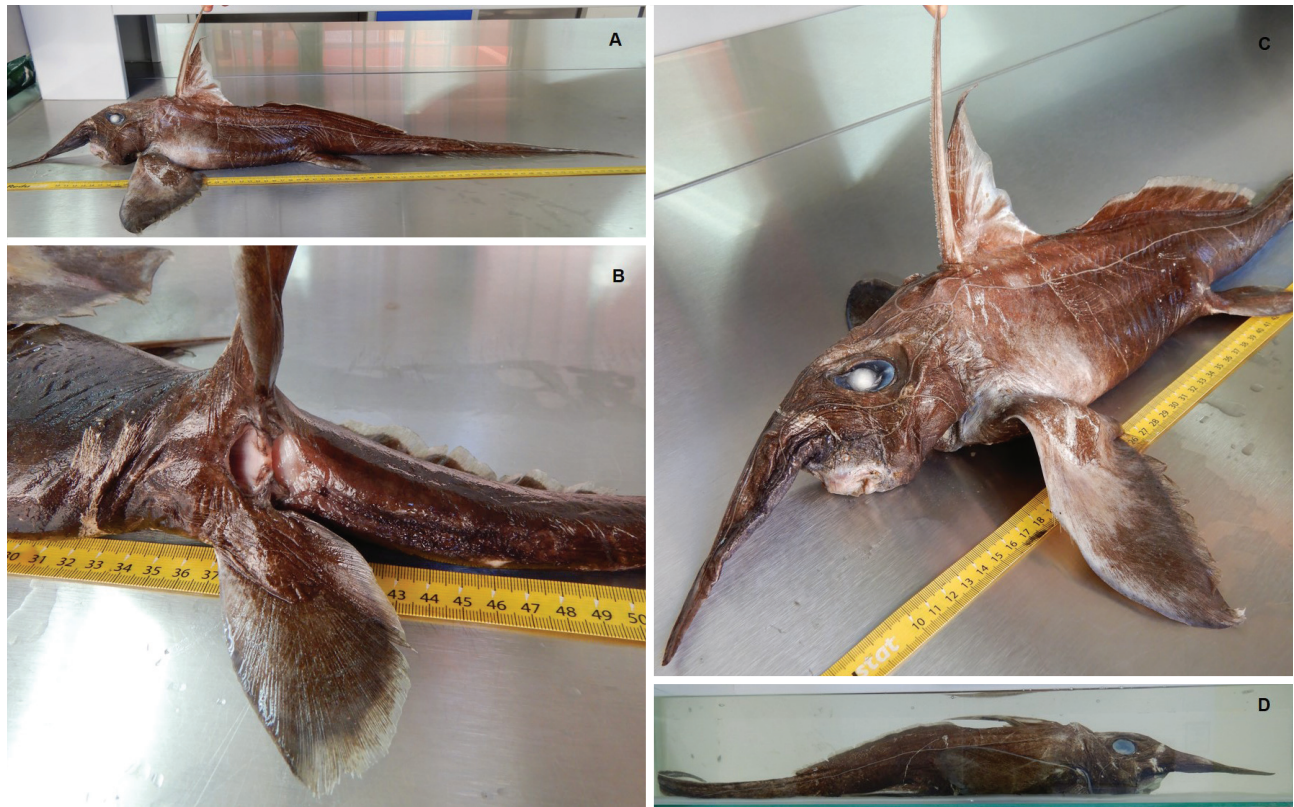
Figura 2. Segundo ejemplar de Harriotta raleighana Goode & Bean 1895 en Jalisco. A) Vista lateral donde se observa el color café claro del espécimen y el cuerpo sin marcas copulatorias en el cuerpo. B) Vista ventral donde se observa el área del ano con la ausencia de claspers. C) Vista frontal donde se observa una marca en la base de la proboscis, que pudo haber sido provocado por el arte de pesca donde se encontró. D) Vista lateral del espécimen preservado e incluido en la colección científica (CZUG1042).

con el registro CZUG1041, y resguardado en las instalaciones del CUC. Ambos ejemplares están preservados en contenedores de cristal que permiten su observación directa (Fig. 2d), lo que favorecerá su estudio y adecuada preservación (Espinosa, 2003).